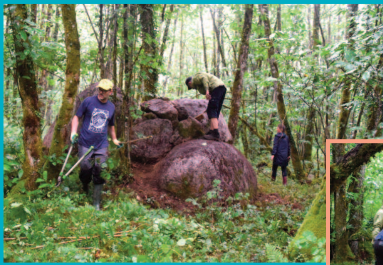
Séance de nettoyage du dolmen d'Augignac

La découverte d'armatures de flèches tranchantes, d'une lame en silex et de tessons de céramique confirment son utilisation opportuniste par les populations du Néolithique Moyen.