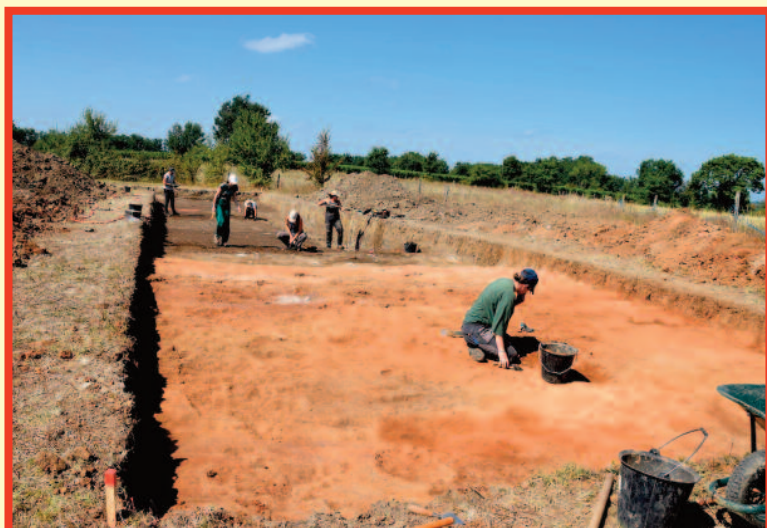
Les fouilles en cours sur le rempart de Blis